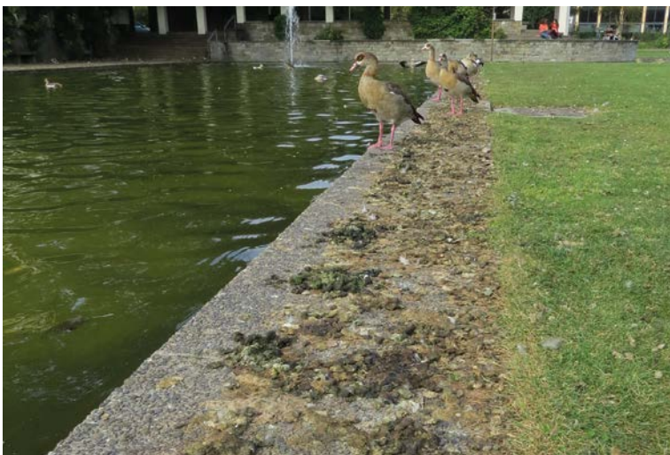
Abb. 2: Nilganskot am Schlafplatz auf dem Beckenrand der Herbert-Anlage in Wiesbaden 2019. - Egyptian Goose droppings at the roosting site on the pool edge of the Herbert-Anlage in Wiesbaden 2019.

Auf Naherholungsflächen finden sich öfter Wasservogel-Ansammlungen, die durch ihren Kot Liegewiesen, Wege und Gewässerufer verschmutzen, was vielerorts durch die Zunahme der Bestände von Grau-, Kanada-, und Nilgans noch verstärkt worden ist (Conover & Chasko 1985; König et al. 2013; Rösler & Stiefel 2018). Eine Aufklärung über die negativen Auswirkungen der Fütterung und Fütterungsverbote sind häufig genannte Managementmaßnahmen, um Wasservogel-Ansammlungen und Verschmutzungen zu reduzieren (Smith et al. 1999; Coluccy et al. 2001; König et al. 2013, Rösler & Stiefel 2018; Fox 2019). Die Fütterung kann als Ursache von Gänse-Ansammlungen in Parks aber auch eine weniger bedeutende Rolle spielen, da diese allein schon durch große Rasenflächen angezogen werden, die an Wasser grenzen (Conover & Kania 1991; Mackay et al. 2014; Rösler & Stiefel 2019). In einer Situation, in der schon problematisch viele Wasservögel vorhanden sind, sollten jedoch