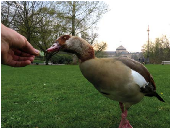
Abb. 3: Eine Nilgans frisst von der Wiese abgerupfte Blätter aus der Hand. Die Fütterung ermöglicht eine Verbindung mit wilden Tieren. - Hand-feeding of an Egyptian Goose with leaves plucked from the meadow. Feeding allows a connection with wild animals.

Menschen, die Vögel füttern, handeln nicht nur aus Eigennutz (Freude an der Beobachtung und Begegnung), sondern auch deshalb, weil es ihnen das Gefühl gibt, dass sie der Natur angesichts der Zerstörung durch den Menschen etwas zurückgeben können und dass sie die Vögel beschützen und für sie sorgen können (Jones 2011). Deshalb sollten engagierte Fütterer in Citizen-Science-Projekte integriert und ihnen die nötigen Informationen geliefert werden, damit sie durch die Fütterung möglichst viel Nutzen erreichen und möglichst wenig Schaden anrichten (Jones 2011). Die Fütterung bietet die Gelegenheit, Wasservögel aus der Nähe zu beobachten und die Arten kennenzulernen (Schaad et al. 2018). In der Fütterung äußert sich ein Bedürfnis vieler Menschen und sie ermöglicht den Kontakt zu freilebenden Tieren (Reichholf 2019, briefl. Mitt.; Abb. 3). Das Entenfüttern stellt eine Möglichkeit der